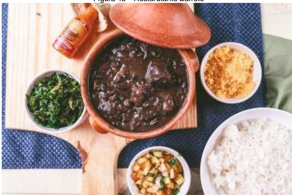
Figura 43 – Restarutante Barreto