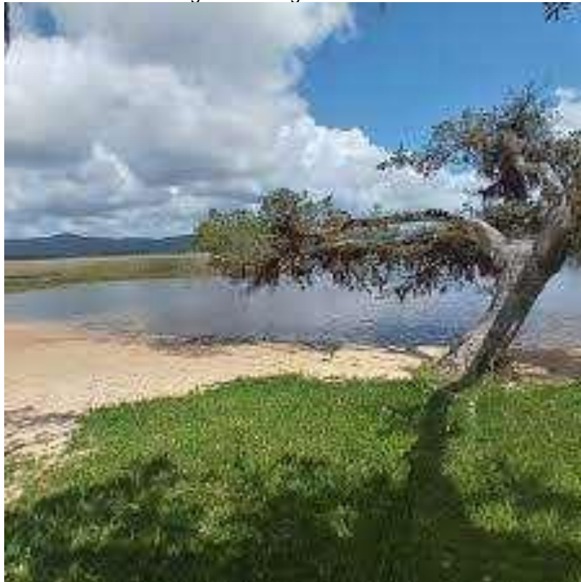
Figura 17 - Lagoa do Horácio