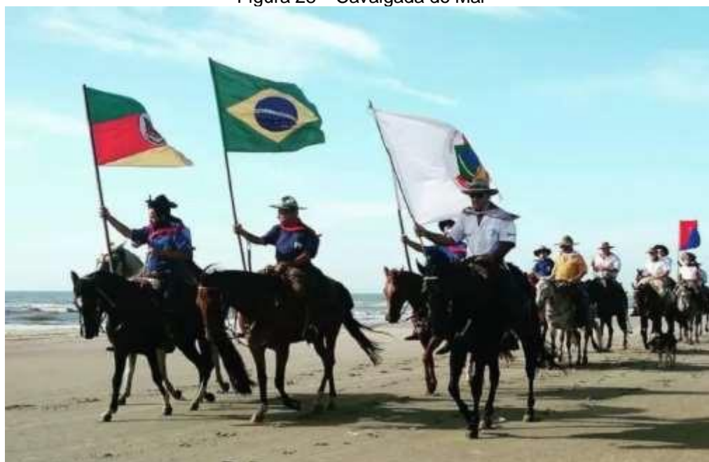
Figura 28 – Cavalgada do Mar