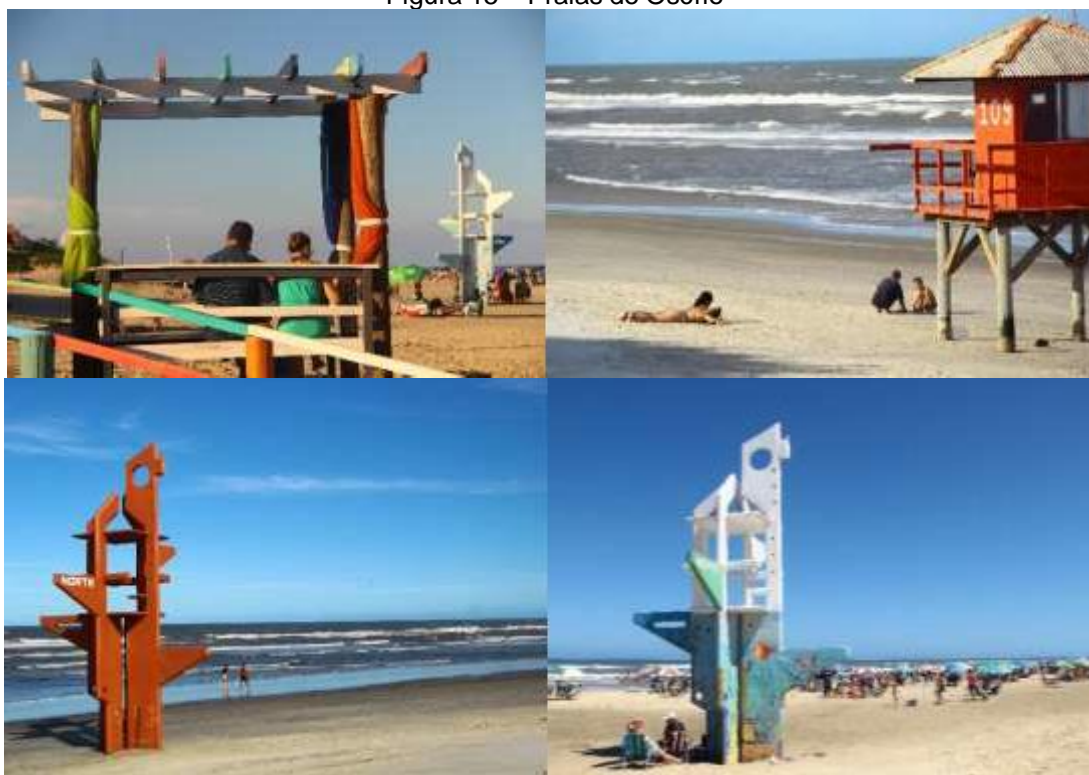
Figura 15 – Praias de Osório