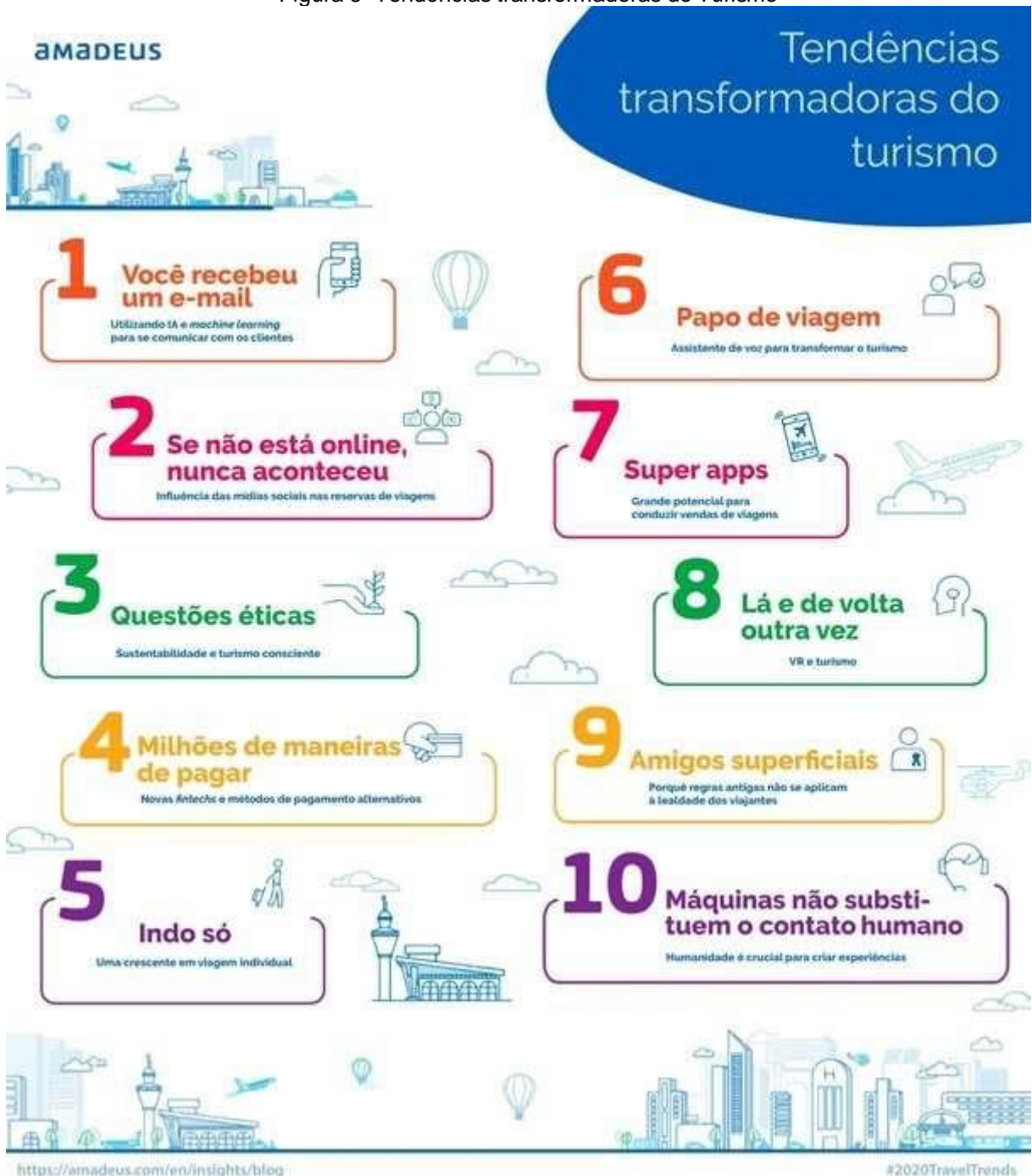
Figura 6- Tendências transformadoras do Turismo