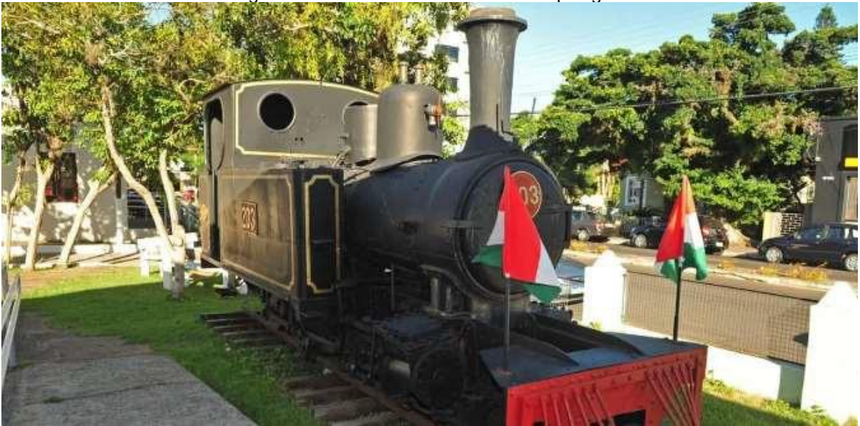
Figura 9 – Museu da Via Férrea e Antropológico