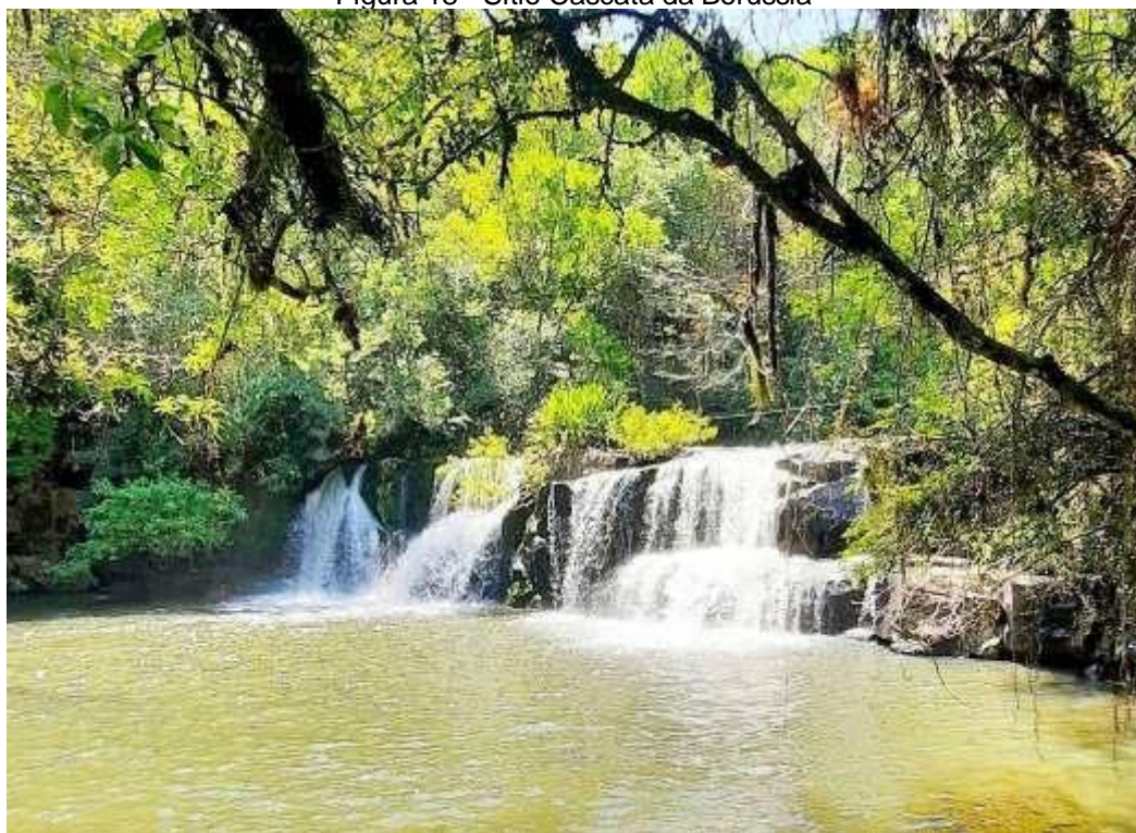
Figura 18 - Sítio Cascata da Borússia