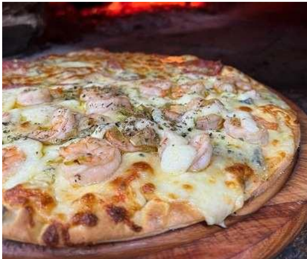
Figura 45 – Á Lenha Pizzaria