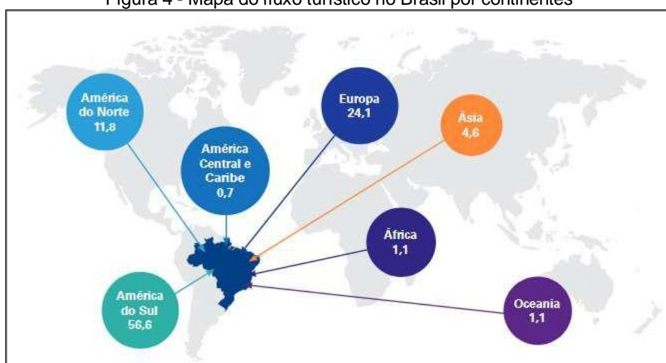
Figura 4 - Mapa do fluxo turístico no Brasil por continentes

O Brasil não faz parte das rotas do Turismo Global. Grande parte dos visitantes são da América do Sul e o maior foco turístico são praias, Rio de Janeiro e Cataratas do Iguaçu. Os gastos do Turismo Internacional no Brasil antes da pandemia eram de USD 6 bilhões, muito incentivados pelo Turismo de Negócios, pelo Turismo de Sol e Praia para turistas da América do Sul e pela venda de pacotes aos visitantes internacionais (BRASIL, 2021). Na figura 4 observa-se a representatividade dos turistas estrangeiros no Brasil por continente.