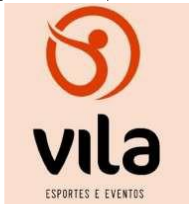
Figura 20 – Vila Esportes e Eventos