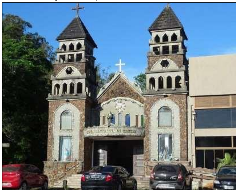
Figura 11 - Capela Santa Rita de Cássia