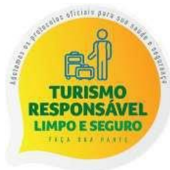
Figura 5 - Selo Turismo Responsável

Em junho de 2020, o Mtur lançou o Selo Turismo Responsável que consistiu num programa que estabeleceu boas práticas de higienização para cada segmento do setor. Foi um incentivo para que os consumidores se sentissem seguros ao viajar e frequentar locais que cumprissem protocolos específicos para a prevenção da COVID-19, posicionando o Brasil como um destino protegido e responsável. Ainda hoje, para ter acesso ao selo, as empresas e guias de turismo precisam estar devidamente inscritos no Cadastro de Prestadores de Serviços Turísticos (CADASTUR). Essa foi a primeira etapa do Plano de Retomada do Turismo Brasileiro, coordenado pelo MTur, com o objetivo de diminuir os impactos da pandemia e preparar o setor para um retorno gradual às atividades.