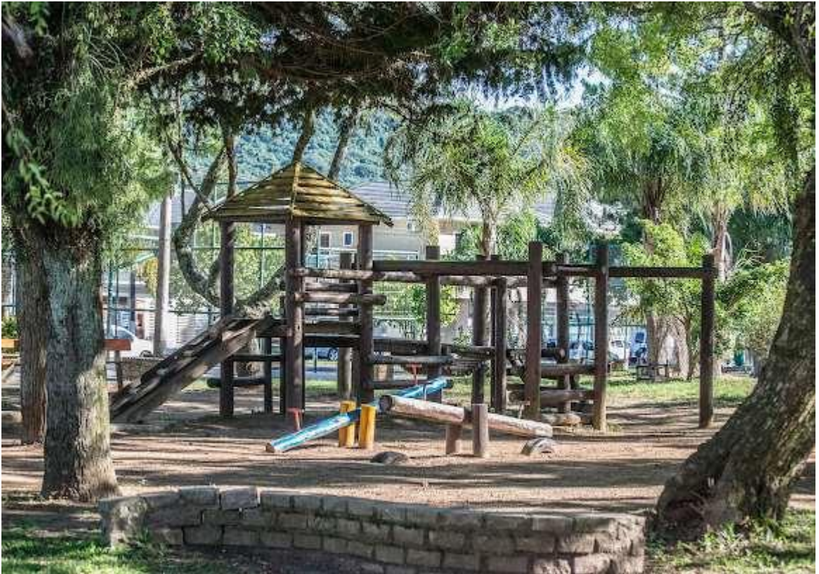
Figura 8 - Praça das Carretas