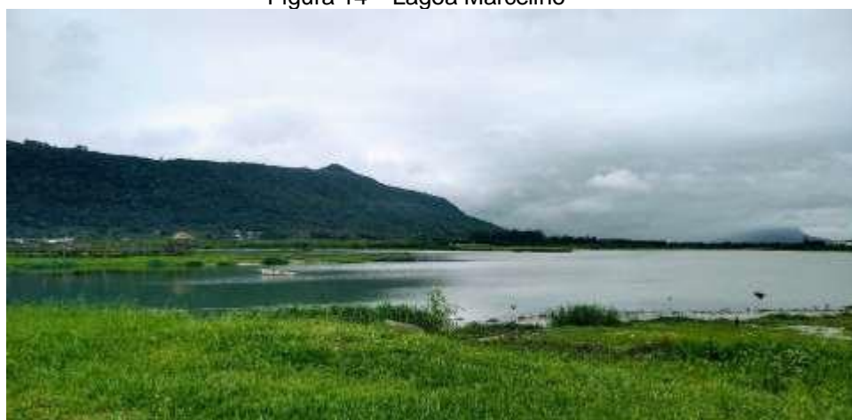
Figura 14 – Lagoa Marcelino