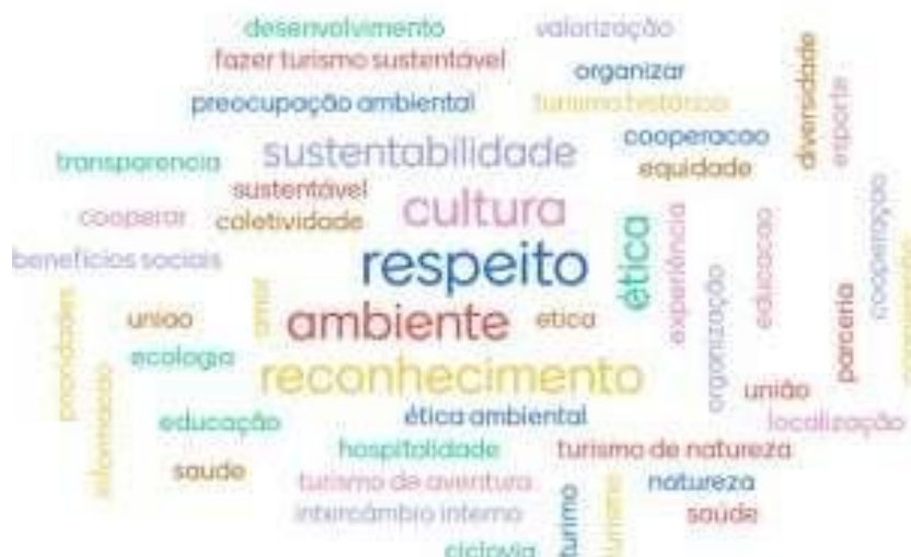
Figura 47 – Resultado dinâmica Valores do P.M.T. de OSÓRIO