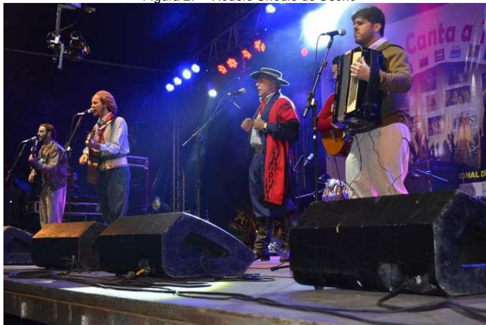
Figura 27 – Rodeio Crioulo de Osório