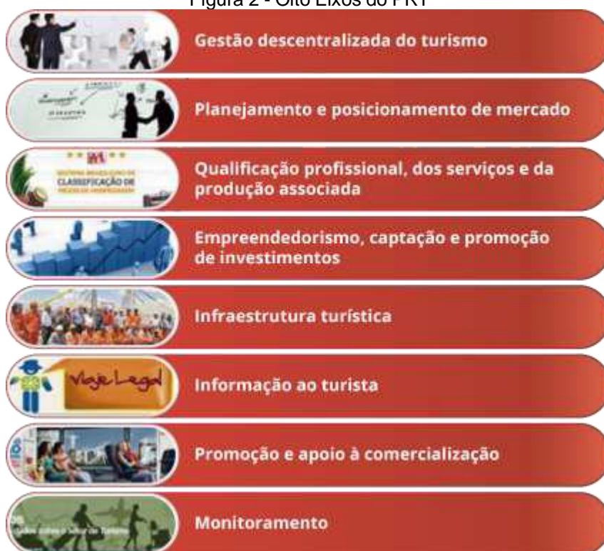
Figura 2 - Oito Eixos do PRT

Conforme citado anteriormente, a elaboração deste Plano Municipal de Turismo tem como principal objetivo a construção do Plano de Ação, com elaboração e seleção das APDs que seguiram os 08 (oito) eixos previstos no Programa de Regionalização do Turismo (PRT). Este programa foi lançado em abril de 2004, como estratégia para o desenvolvimento da atividade turística no território e tem como objetivo a estruturação, ampliação, diversificação e qualificação da oferta turística brasileira, sendo considerada uma das principais estratégias para execução da Política Nacional de Turismo (PNT), devido sua proposta de desenvolvimento de forma descentralizada e regionalizada, com foco no planejamento coordenado e participativo. Dessa forma, as ações de apoio à gestão, estruturação e promoção do Turismo, são traduzidas em oito eixos de atuação e respectivas ações estratégicas conforme ilustrado na figura 2: