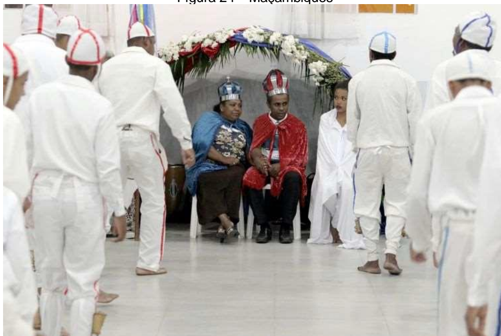
Figura 24 – Maçambiques