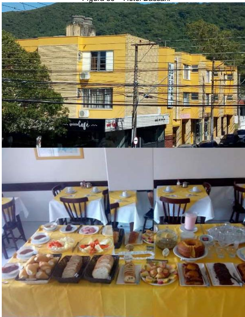
Figura 39 – Hotel Bassani

8.3 Meios de Hospedagens – As opções de hospedagem em OSÓRIO identificadas durante as oficinas são: Big Hotel, Hotel Bassani, Novo Hotel e a Mimi House Pousada.