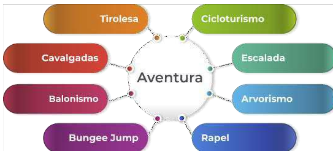
Figura 34– Elementos do Turismo de Aventura