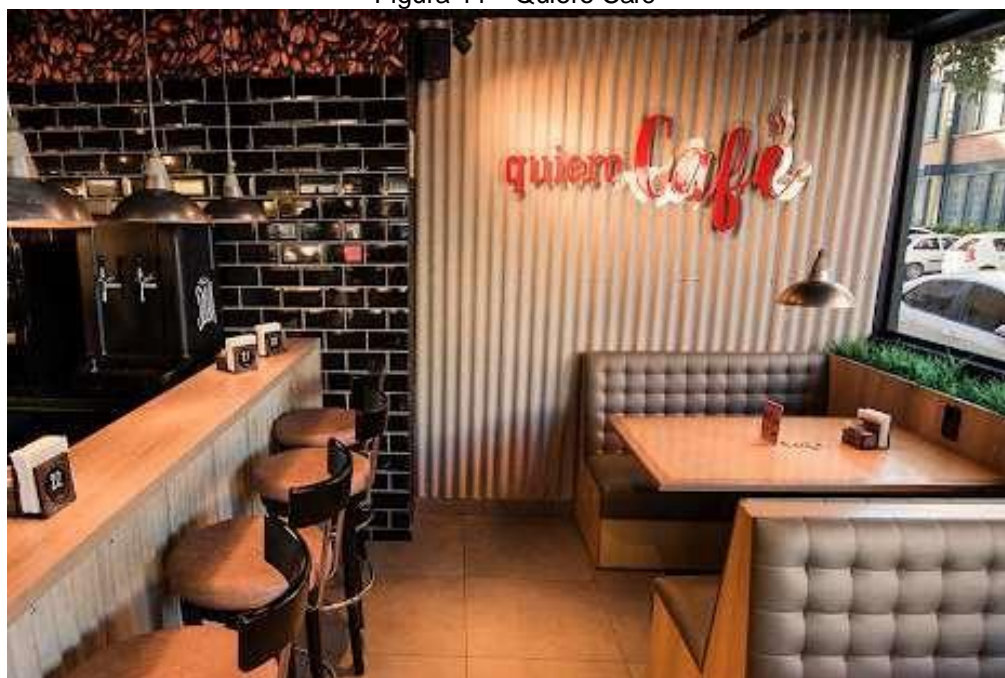
Figura 44 – Quiero Café