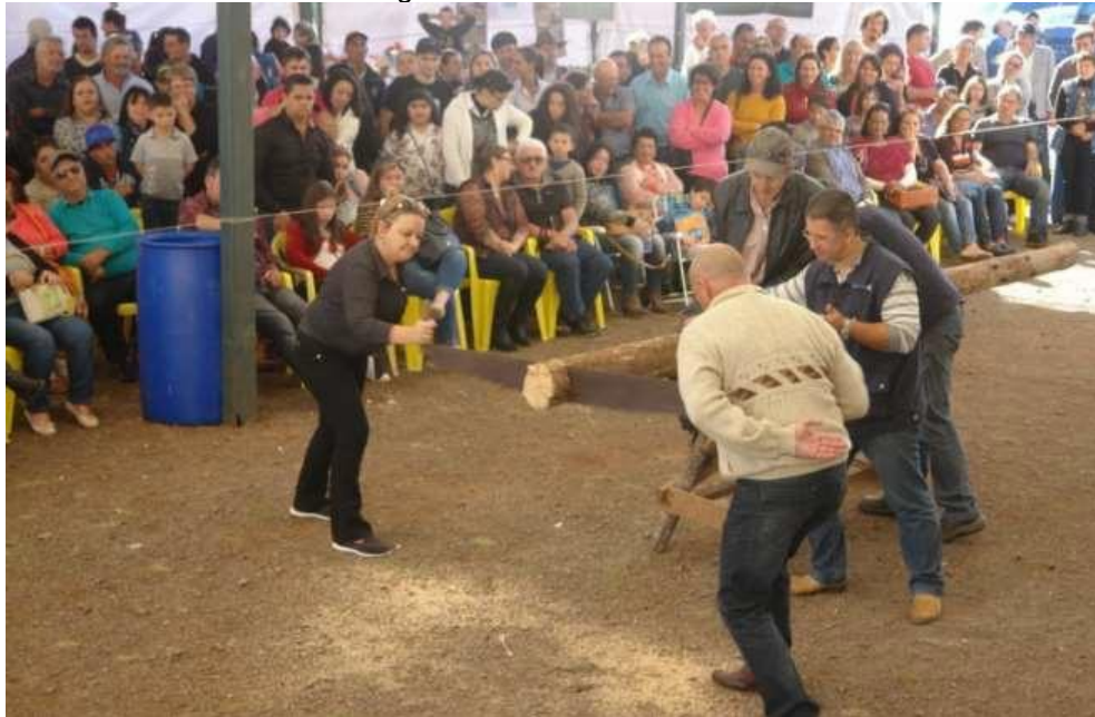
Figura 22 – Festa do Colono