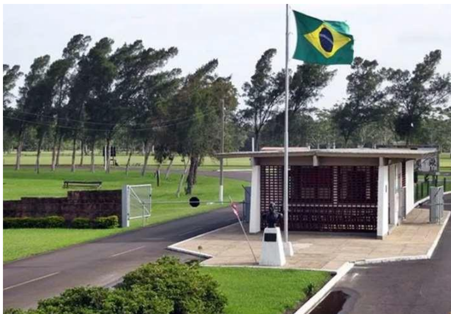
Figura 10 – Parque Histórico Osório