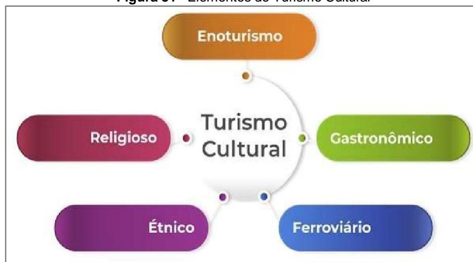
Figura 31– Elementos do Turismo Cultural

Turismo Cultural compreende as atividades turísticas relacionadas à vivência do conjunto de elementos significativos do patrimônio histórico e cultural e dos eventos culturais, valorizando e promovendo os bens materiais e imateriais da cultura (BRASIL, 2010). Dentro desse segmento integram o Arqueológico, Enoturismo, Étnico, Ferroviário, Gastronômico e Religioso. Como se pode observar na figura abaixo: