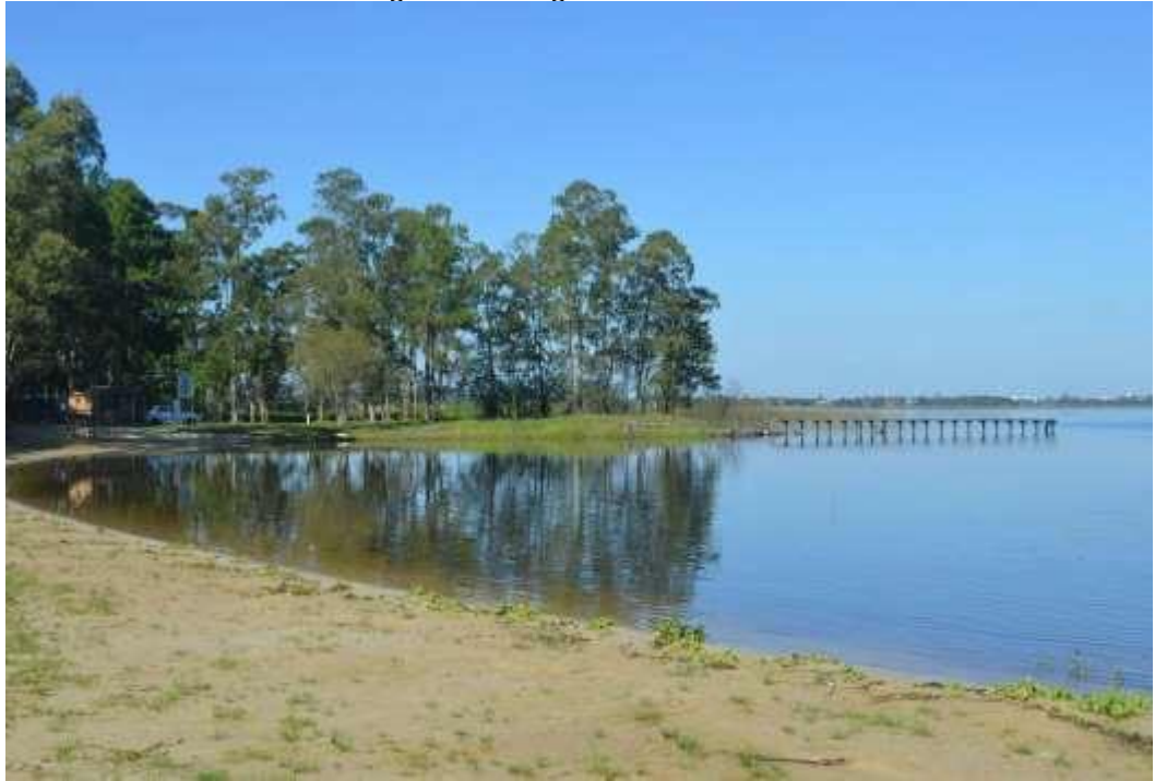
Figura 16 – Lagoa do Peixoto