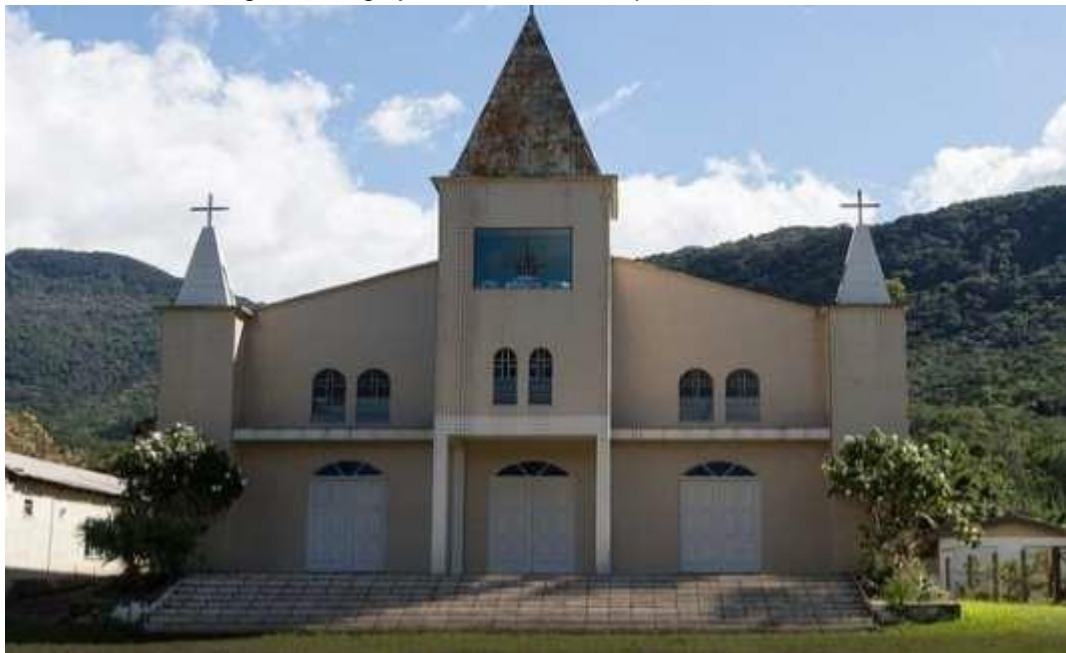
Figura 12 - Igreja Nossa Senhora Aparecida do Sertão