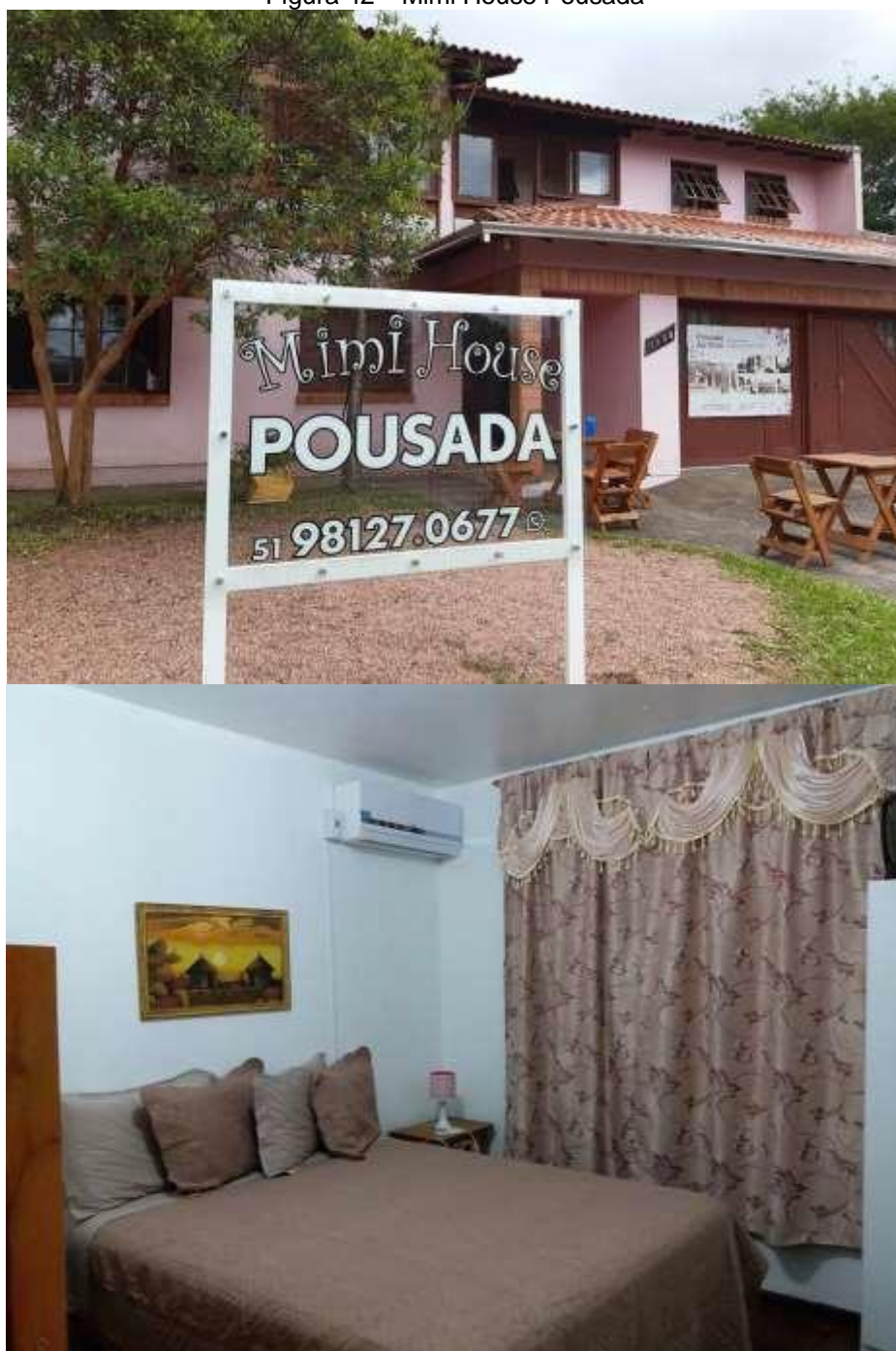
Figura 42 – Mimi House Pousada