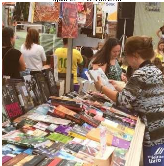
Figura 26 - Feira do Livro