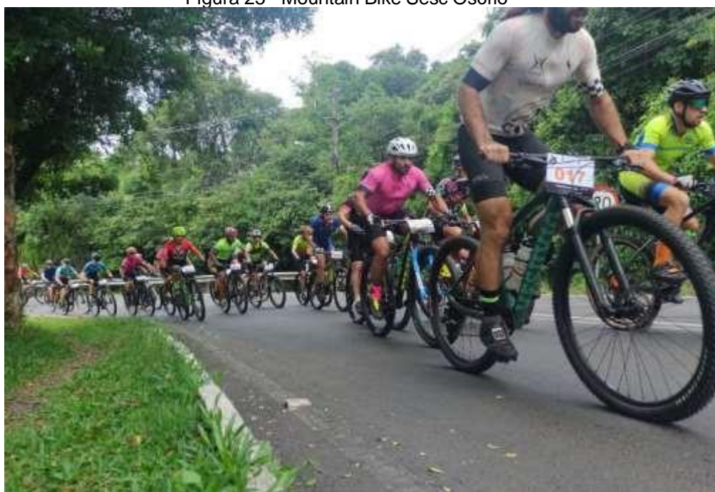
Figura 25 - Mountain Bike Sesc Osório