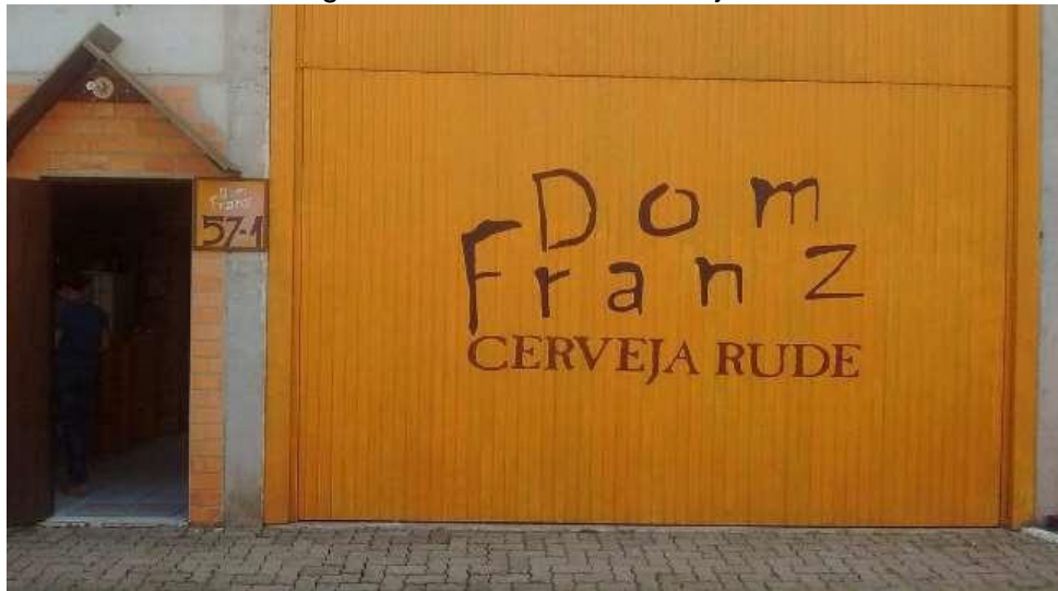
Figura 19 – Dom Franz Cervejaria