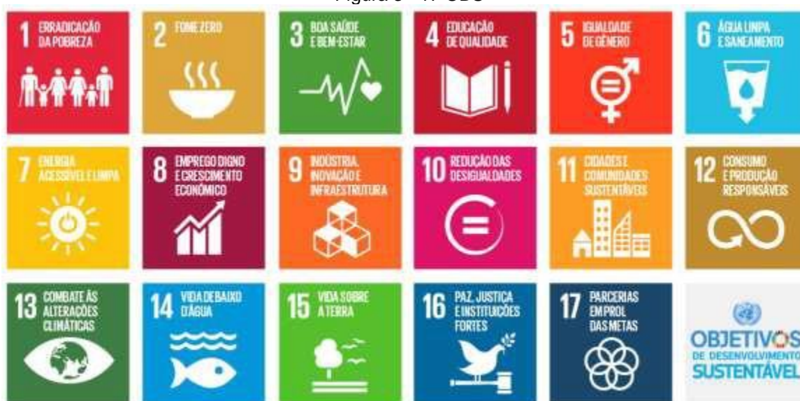
Figura 3 - 17 ODS