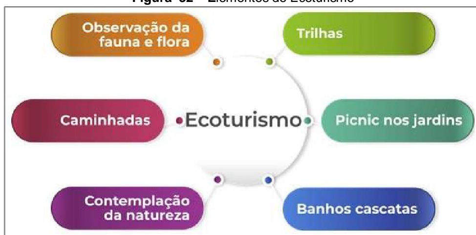
Figura 32 – Elementos do Ecoturismo

Ecoturismo é um segmento da atividade turística que utiliza, de forma sustentável, o patrimônio natural e cultural, incentiva sua conservação e busca a formação de uma consciência ambientalista por meio da interpretação do ambiente, promovendo o bem-estar das populações. Reconhece-se que o Ecoturismo tem liderado a introdução de práticas sustentáveis no setor turístico, mas é importante ressaltar a diferença e não confundi-lo como sinônimo de Turismo Sustentável. Sobre isso, a Organização Mundial de Turismo e o Programa das Nações Unidas para o Meio Ambiente referem-se ao Ecoturismo como um segmento do turismo, enquanto os princípios que se almejam para o Turismo Sustentável são aplicáveis e devem servir de premissa para todos os tipos de turismo em quaisquer destinos (BRASIL, 2010).