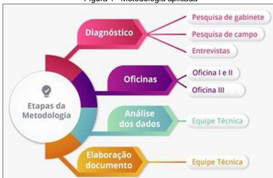
Figura 1 - Metodologia aplicada