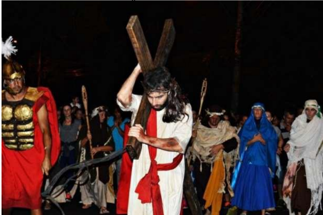
Figura 23 - Via Sacra