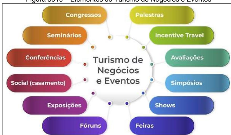
Figura 3019 – Elementos do Turismo de Negócios e Eventos