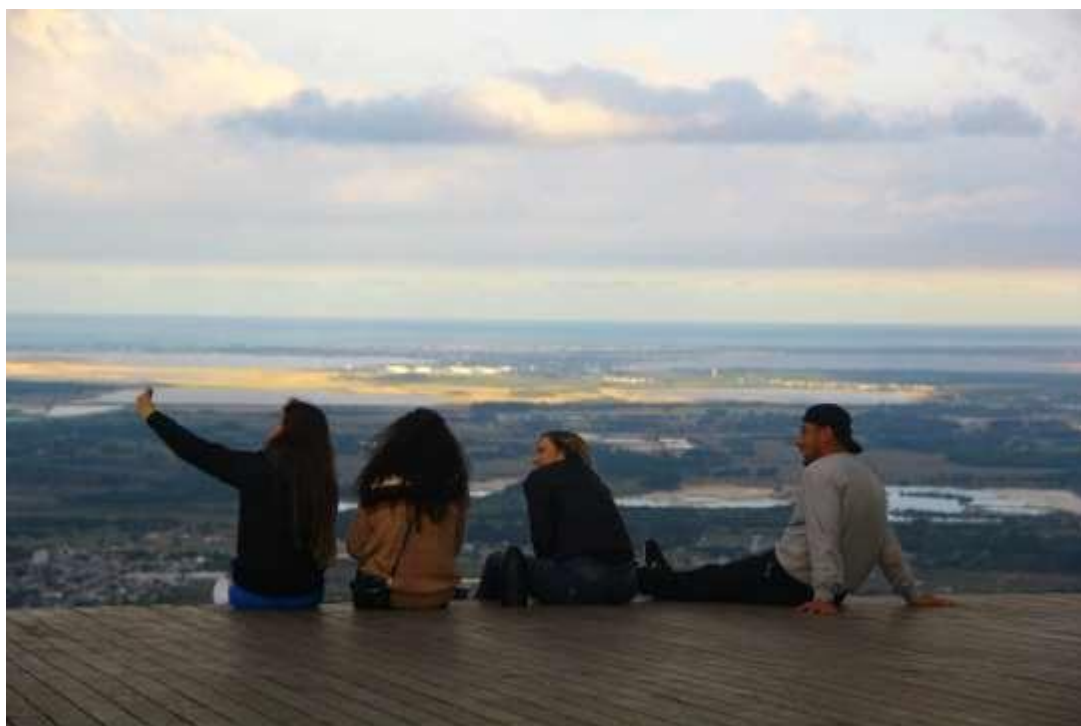
Figura 13 – Morro da Borússia