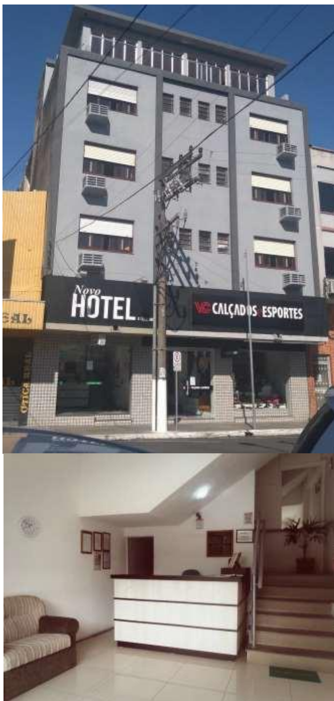
Figura 41 – Novo Hotel