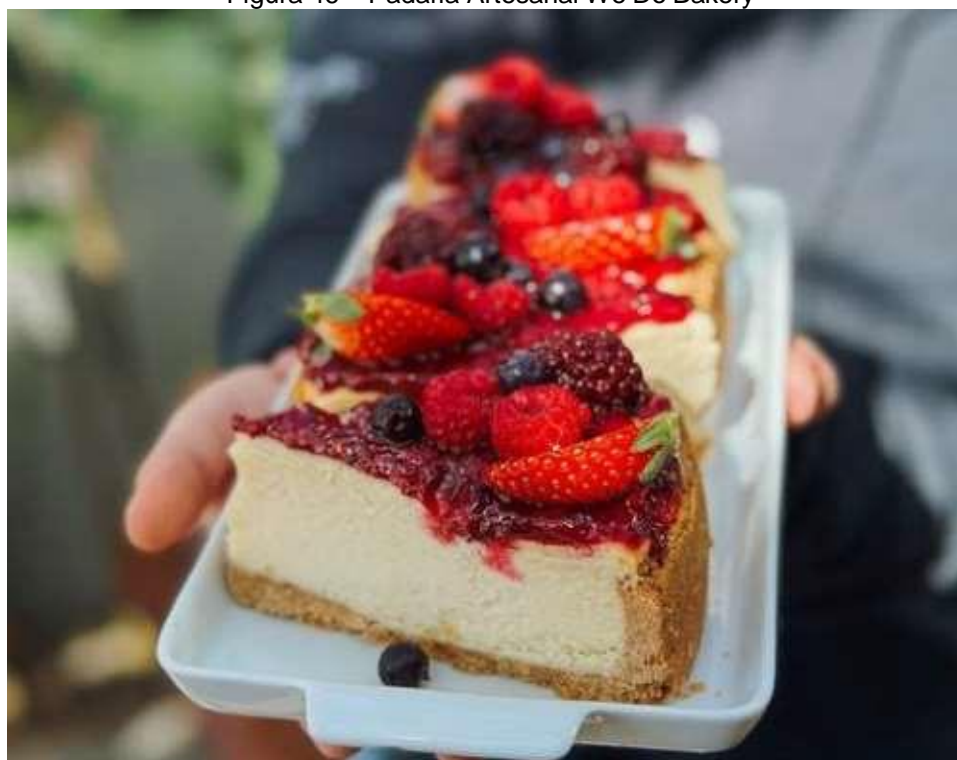
Figura 46 – Padaria Artesanal We Do Bakery