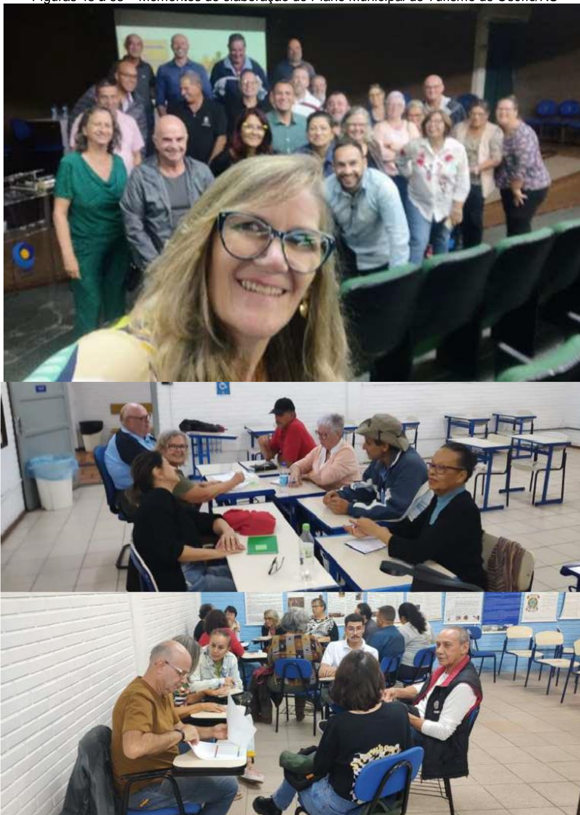
Figuras 48 à 63 – Momentos de elaboração do Plano Municipal de Turismo de Osório/RS