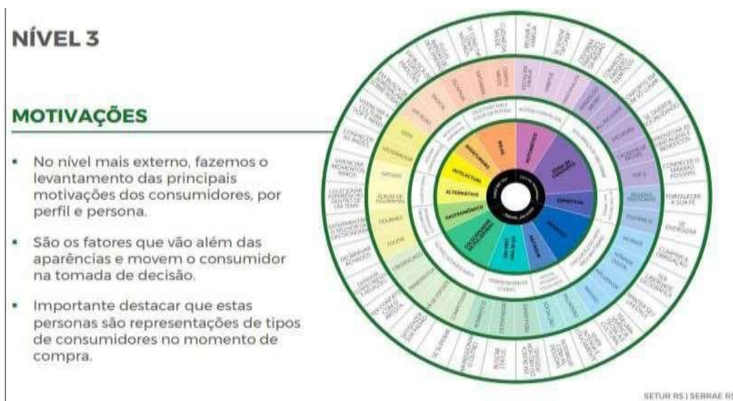
Figura 3720 – Mapa do Comportamento do Turista RS – Motivações