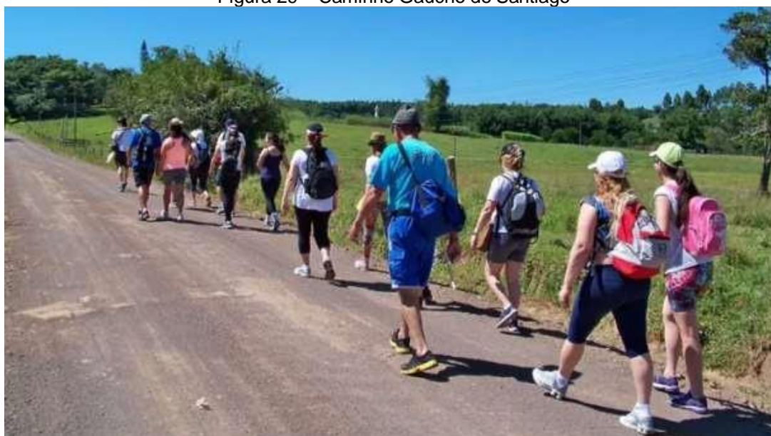
Figura 29 – Caminho Gaúcho de Santiago