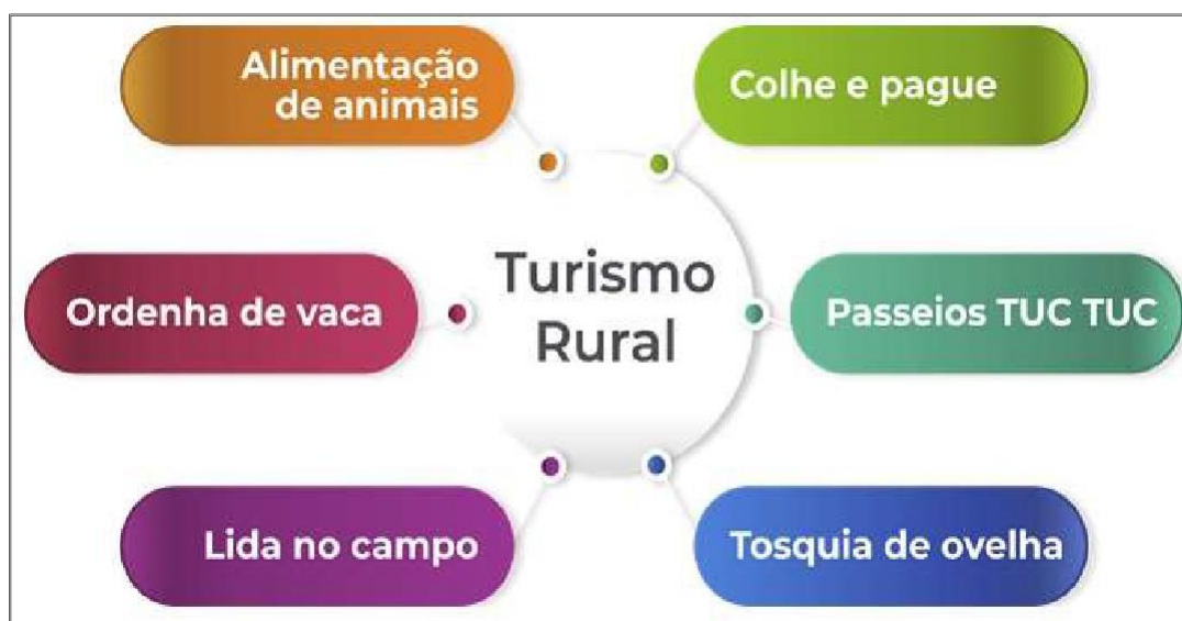
Figura 33 – Elementos do Turismo Rural