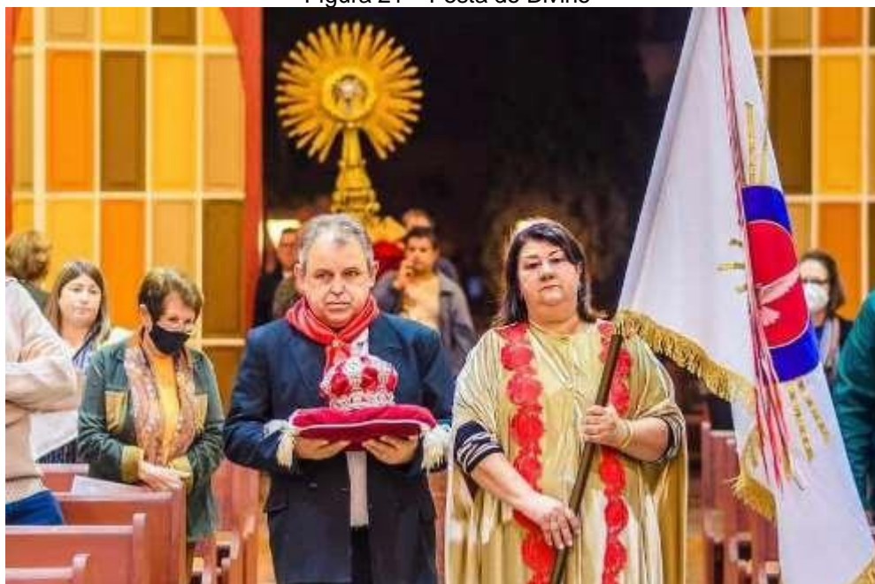
Figura 21 – Festa do Divino