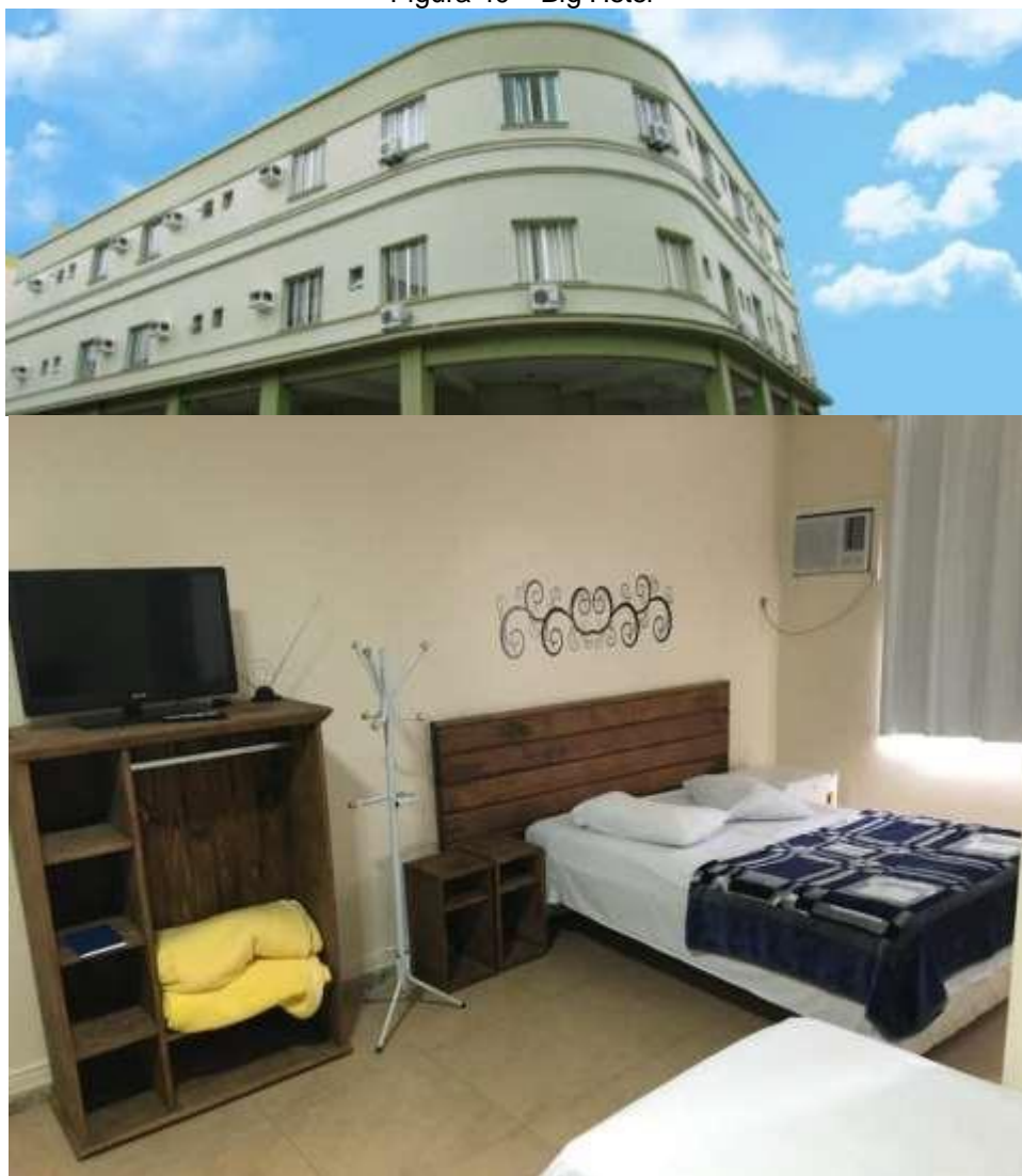
Figura 40 – Big Hotel